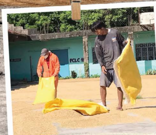
Ligao, Filippinerne Høst af ris.