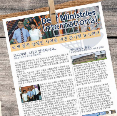
Vi har nu et kvartalsvis DWI koreansk nyheds- brev, som du kan finde på vores websted.