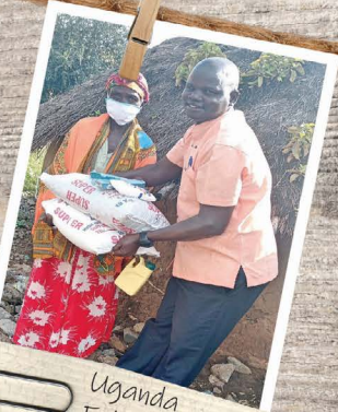
Uganda Enke, der modtager en madpakke.