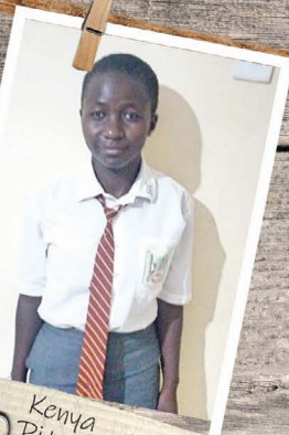
Kenya Ritas historie er med i Andrews seneste blog på hjemmesiden