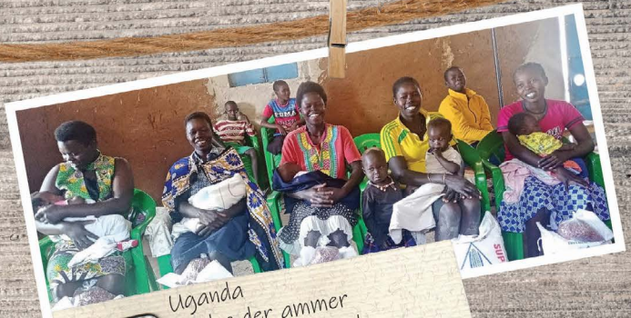
Uganda Mødre der ammer der modtager mad.