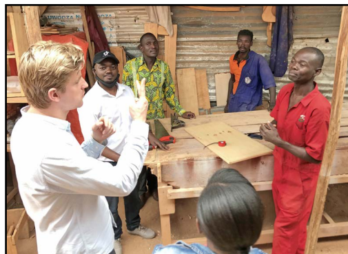
MREDF Tømmer- og snedkerforretning.