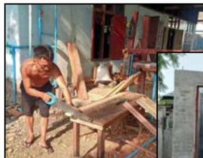
Til venstre: fremstilling af bord og stole Nedenfor: nye toiletter

Efter måneder med voldsomme kampe har vi endelig fået nyt om kirken i Pyindaw Oo i den nordlige del af landet. De fleste af landsbyboerne er flygtet, nogle til Indien og andre til Kalay. På trods af skud- og brandskader på mange bygninger i området, er vores kirkebygning forblevet urørt! Pris Gud for hans beskyttelse. Vi håber snart at kunne genoptage gudstjenesterne.