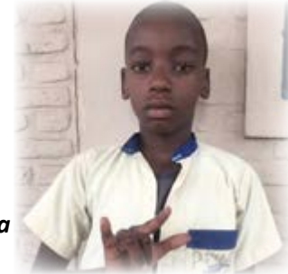
Prince Carmel Nduwimana