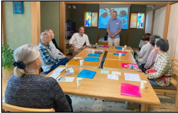
Nagoya huskirke, Japan