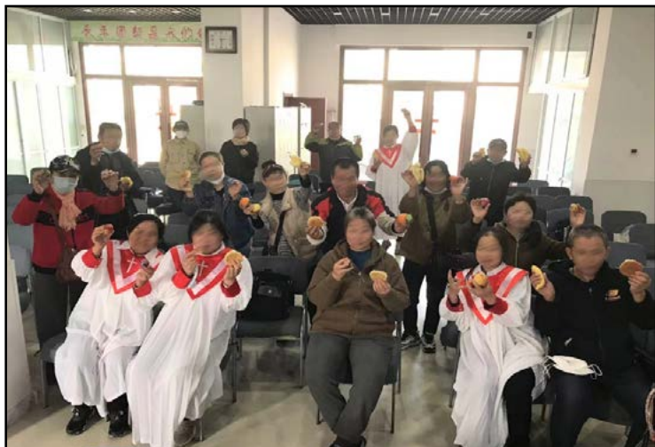
En godbid med kiks, frugt og æg

I K støder kirken på store vanskeligheder og forhindringer. De beder om bøn for, at Gud må vejlede dem i deres næste skridt. Bed for alle døvekirker i Kina.