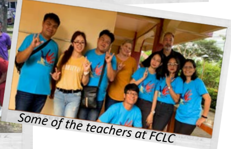
Some of the teachers at FCLC