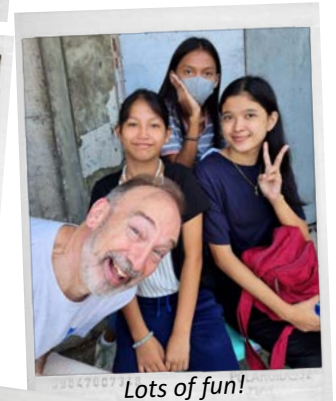
Lots of fun!