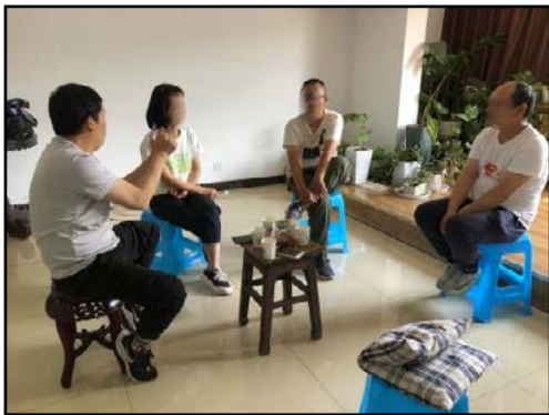
Ny placering af kaffebar