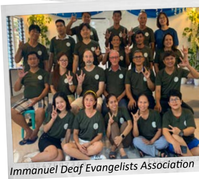
Immanuel Deaf Evangelists Association