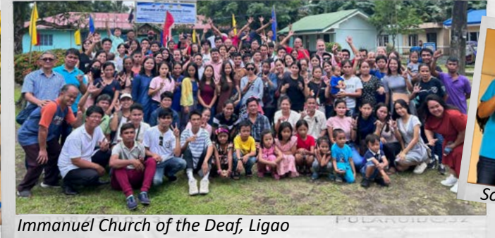
Immanuel Church of the Deaf, Ligao