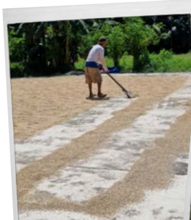
Tørring af ris