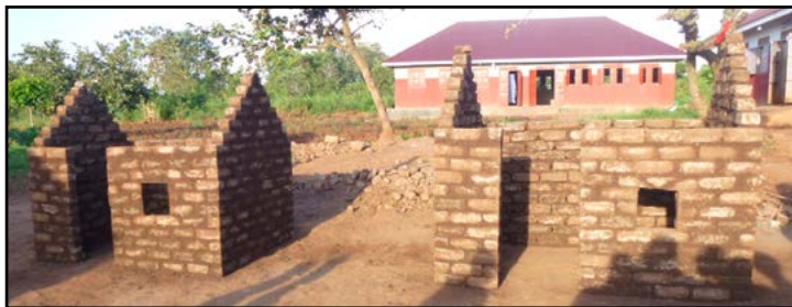
Ovenfor: Modelhuse Til højre: Frisør

Skolen har kun ét borehul til at levere vand til hele skolen. Det er i øjeblikket i stykker, og skolen er meget bange for, at de ikke vil have adgang til vand, og hvis sundhedsmyndighederne finder ud af det, vil de lukke skolen, hvis de kender til situationen. Teknikeren har tjekket for problemer, og de fleste dele skal udskiftes.