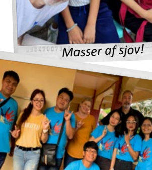
Nogle af underviserne på FCLC