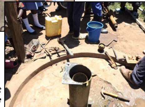
Det er rigtigt: Ødelagt borehulspumpe