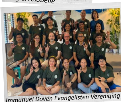
Immanuel Doven Evangelisten Vereniging