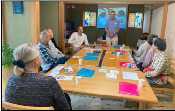
Nagoya huiskerk, Japan