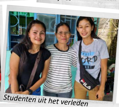
Studenten uit het verleden