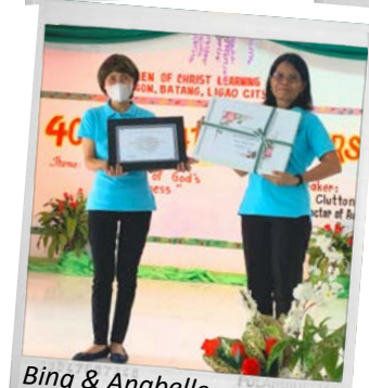
Bing & Anabelle