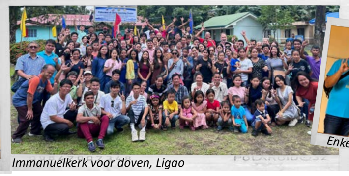
Immanuelkerk voor doven, Ligao