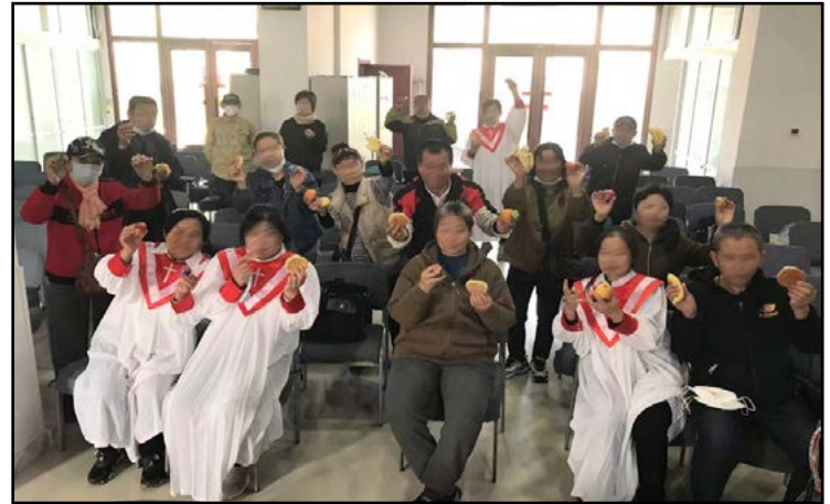
Een traktatie van koekjes, fruit en eieren

In K ondervindt de kerk grote moeilijkheden en obstakels. Ze vragen om gebed dat God hun volgende stappen mag leiden. Bid voor alle dovenkerken in China.