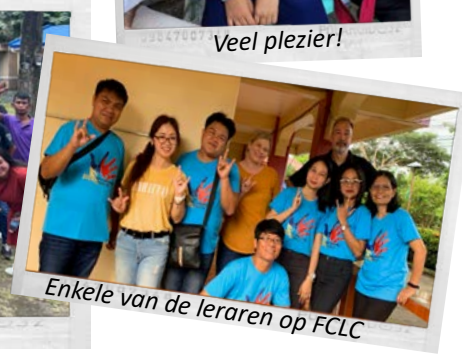
Enkele van de leraren op FCLC