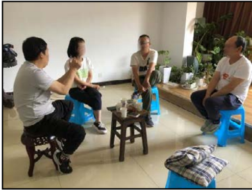
Nieuwe locatie coffeeshop

de plaatselijke kerken niet kunnen of niet doen. Broeder C is naar D gekomen om de toekomst van het vertaalwerk en de koffieshop te bespreken.