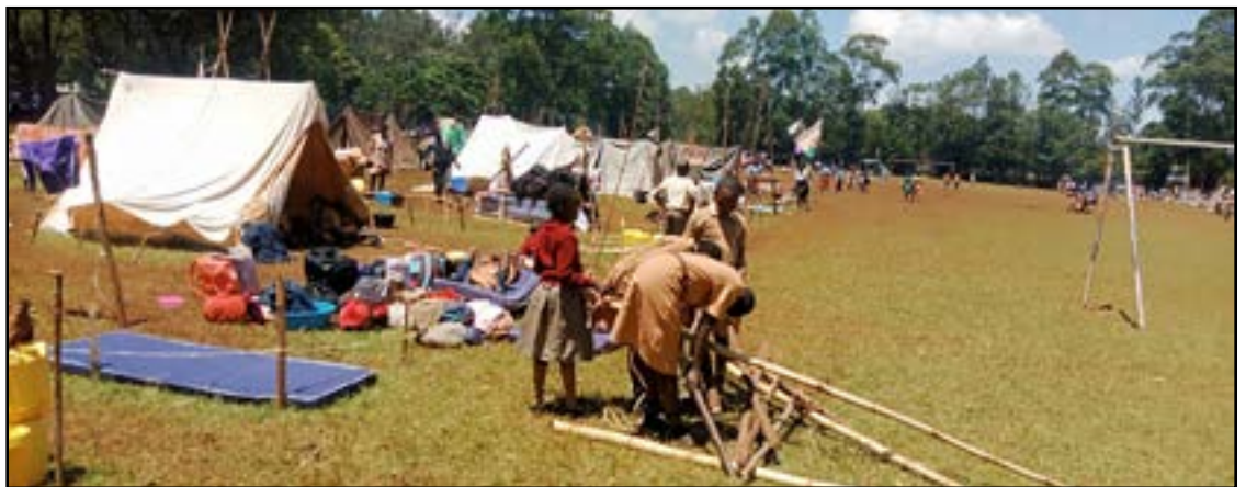
Studerende, der deltager i spejderarbejde

Med støtte fra DMI-partnere fra Norge og Australien er skolen blevet malet, og latrinbrøndene er blevet gravet, bygget og malet. Det lykkedes IICS at montere femten nye døre på toiletterne. De vil gøre det muligt for skolen at bestå