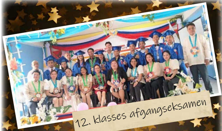
12. klasses afgangseksamen