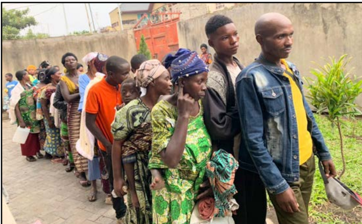
Waiting for food