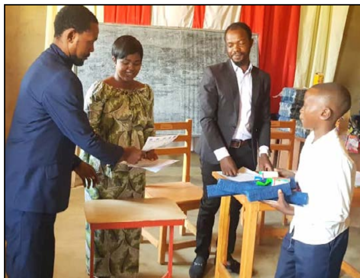
Student receiving gifts

Takket være donationer fra DA-støtterne var skolen i stand til at uddele sæber, notesbøger, kuglepenn, linealer, matematiske værktøjskasser, kiks, slik, balloner og palmeolie til alle eleverne. De blev modtaget med glæde. Skolen tilbyder løbende træning i tegnsprog til Beni Secondary Schools hørende lærere. Det vil hjælpe dem til at undervise døve elever mere effektivt. Vi arbejder på at skabe en mere sikker og effektiv måde for børnene at komme i skole på. Lærere og personale bruger i øjeblikket motorcykler til at hente eleverne. Vi overvejer at skaffe en skolebus til at transportere elever, der bor langt fra skolen.