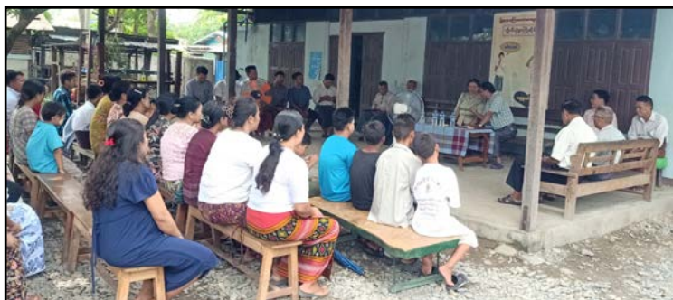
Gudstjeneste i kirken

Støtterne ville have modtaget et brev om den tragiske situation i Myanmar i øjeblikket. Pa-Lian rapporterer, at livet i Yangon, selv om det bliver dyrere og dyrere, er relativt stabilt. På trods af de kraftige regnskyl (det er regntid nu) er kirkegangen god, og de helliges kærlighed er stærk.