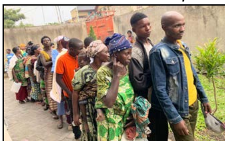
Venter på mad