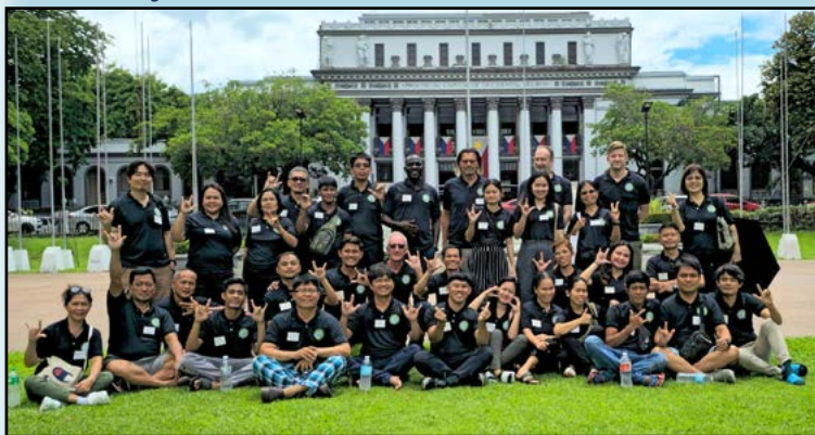
Faderhjerte-skolens ledere og deltagere

'Fatherheart A'-skolen er et ugelangt seminar, som fokuserer på Gud Faderens kærlighed. Faderens kærlighed, tilgivelse, helbredelse og 'sønneskab' er centrale elementer i undervisningen. I slutningen af ugen opfordres deltagerne til at skrive breve til deres forældre og bede om tilgivelse. (Mange døve i udviklingslandene kommer fra voldelige hjem. Helbredelse starter med at bede om tilgivelse for ens egne fejl, ikke med at genkalde sig sår).