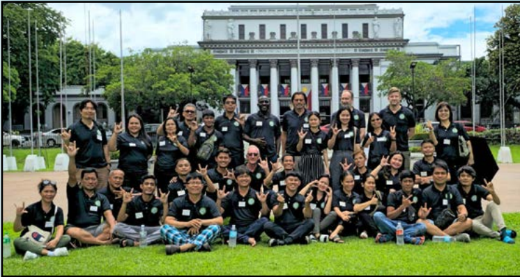
Leiders en deelnemers van de Vaderhartschool

De 'Vaderhart A' school is een seminar van een week waarin de liefde van God de Vader centraal staat. De liefde van de Vader, vergeving, genezing en 'zoonschap' staan centraal in het onderwijs. Aan het einde van de week worden de deelnemers aangemoedigd om brieven naar hun ouders te schrijven waarin ze om vergeving vragen. (Veel doven in ontwikkelingslanden komen uit mishandelde gezinnen. Genezing begint met het vragen om vergeving voor het eigen onrecht, niet met het herinneren van pijn).