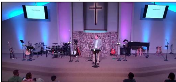
Four Winds Church

Jeg var inviteret til at holde en DMI-præsentation før gudstjenesten for omkring 50 medlemmer af kirken, før jeg holdt en DMI-relateret prædiken i gudstjenesten for hele kirken. Four Winds Church har længe været en generøs støtte for DMI, og kirkens medlemmer gravede dybt for også at give individuelt. Derefter gik vi alle ud og spiste havkat til frokost, den berømte sydstatsgæstfrihed var i fuld gang.