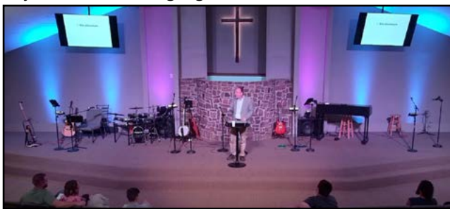
Four Winds Church

Ik was uitgenodigd om voor de dienst een DMI-presentatie te geven aan zo'n 50 gemeenteleden en daarna een DMI-gerelateerde preek te houden voor de hele kerk. Four Winds Church is al lange tijd een gulle supporter van DMI en de gemeenteleden groeven diep om ook individueel te geven. Daarna gingen we met z'n allen lunchen met meerval, de beroemde zuidelijke gastvrijheid was in volle gang.