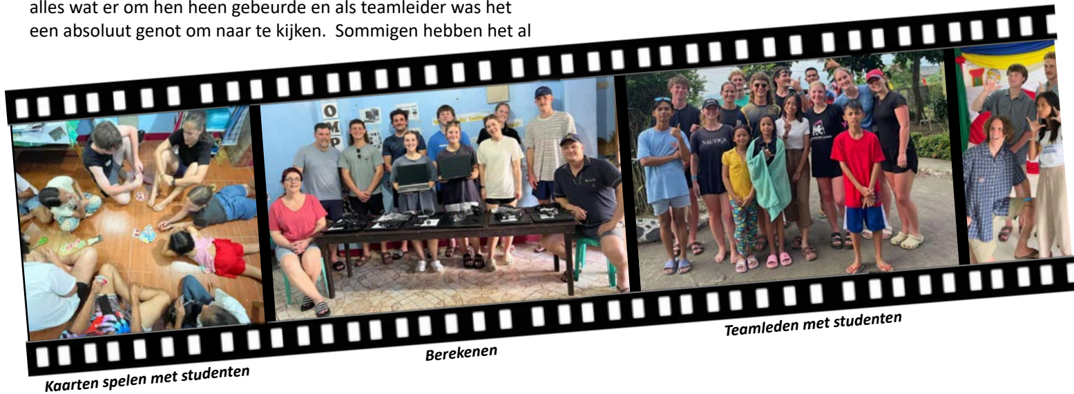
Kaarten spelen met studenten