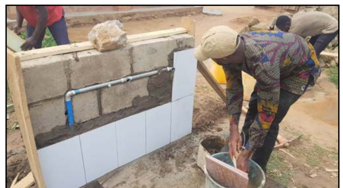
Bygning af en af vandfontænerne