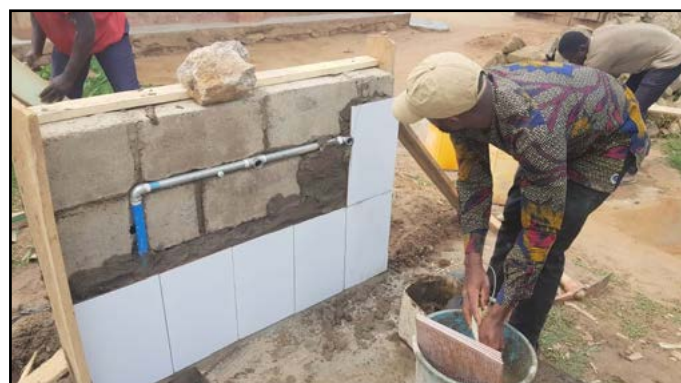
Een van de waterfonteinen bouwen