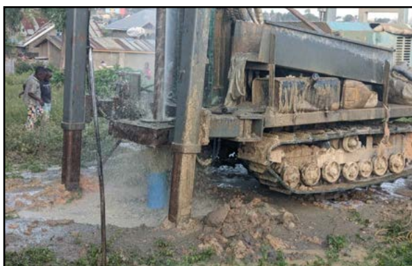
Het boorgat boren

Onze oprechte dank gaat uit naar de Australische stichting die de subsidie heeft verstrekt. Subsidies veranderen levens. Als je verbonden bent aan een stichting of trust, overweeg dan om een subsidie te verstrekken voor het werk dat DMI en DA doen.