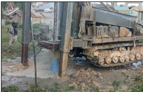
Boring av borehullet