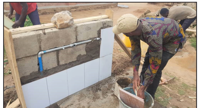
Bygging av en av vannfontene