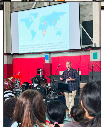
Okinawa Christian School International