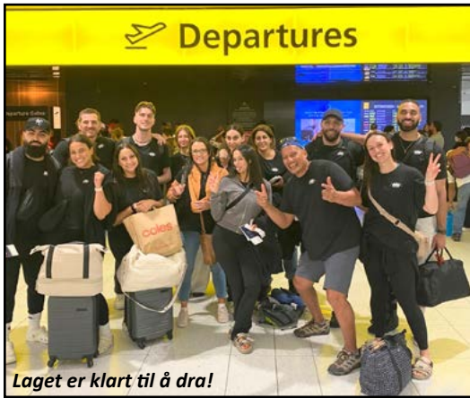
Laget er klart til å dra!

Teamet lyktes med å renovere kantinen, blant annet med nye bord og stoler, fryser, skilting, vifter og ekstra varer til hyllene,