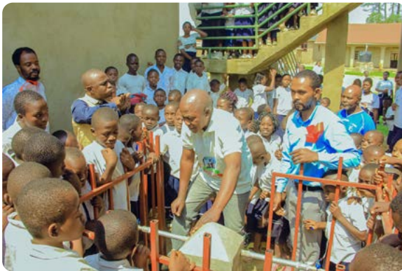
Opening of the fountain

Takket være et tilskudd fra en australsk stiftelse ble det primære borehullet satt opp på skolens område, noe som gir rent vann til 300 medlemmer av skolesamfunnet, mens 10 rør fører vann ut til de omkringliggende byene og landsbyene, overvåket av lokale høvdinge,