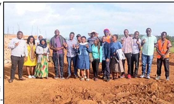
Rwandiske styremedlemmer samles til bønn

Denne nye bibelskolen for døve i Afrika er en del av en større visjon om å etablere tre døveseminarer, ett i hvert av landene Afrika, Europa/Midtøsten og Asia, for å utdanne døve til å bringe evangeliet til døve på lokale tegnspråk over hele verden. Vi gleder oss veldig til dette.