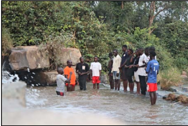
Dåp av 8 døve ungdommer

To outreachere i Uganda førte til at flere titalls kom til tro på Jesus. En ungdomsleir for døve i Koboko i Sør-Uganda i begynnelsen av desember førte åtte unge døve til tro. Og under en outreach i byen Kangole i det østlige Uganda kom 30 nye troende til bekjennelse og overga sine liv til Kristus. Vi gleder oss med takknemlige hjerter over disse beslutningene.