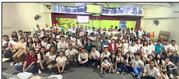
Bacolod Immanuel-kirken for døvne