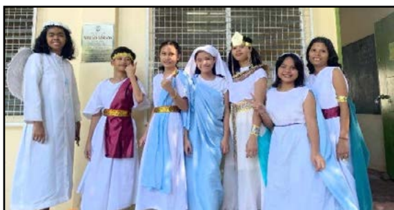
Kostymer til bibelske karakterer

Våre PICD-forsamlinger rundt Negros Island på Filippinene fortsetter å forkynne Guds ord til mange døvne i Bacolod og nærliggende områder. Pastorene har besøkt mange døvne hjemme og oppmuntret dem til å komme til kirken, der de kan få undervisning om Guds ord og være omgitt av andre kristne. De tilbyr også muligheten til å delta i søndagsgudstjenester via Zoom. Stadig flere døvne deltar personlig på søndagsgudstjenester i kirke