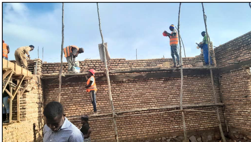
Byggeri af ny bibelskole