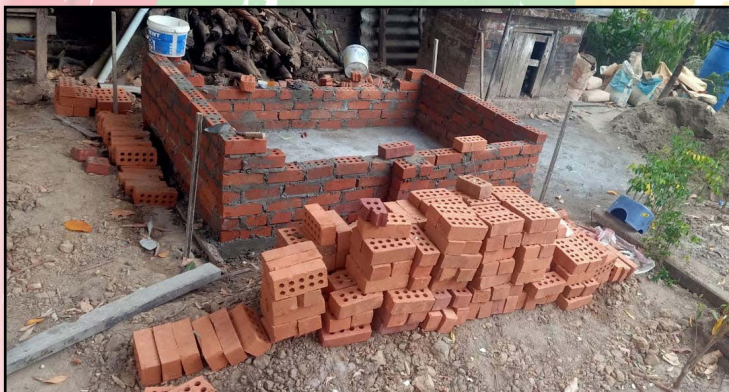
Dåbsbassin ved at blive bygget i Yangon