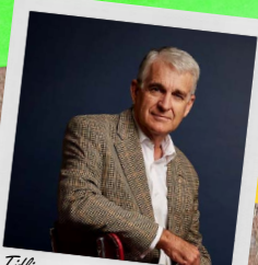
Tidligere vicepremierminister Hon John Anderson AC FTSE

Sydney trivia-aften i St Mark's Anglican Church, Northbridge