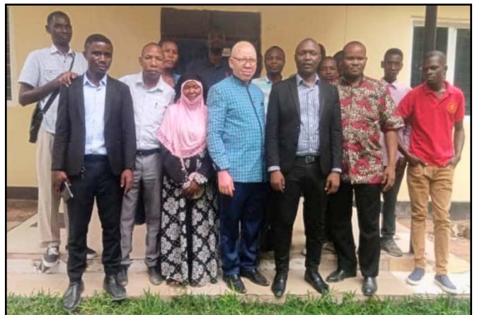
Ny kirkeplantning i Shinyanga