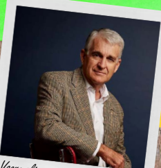
Voormalig vice-premier Hon John Anderson AC FTSE

Sydney trivia-avond in de Anglicaanse kerk St Mark's, Northbridge