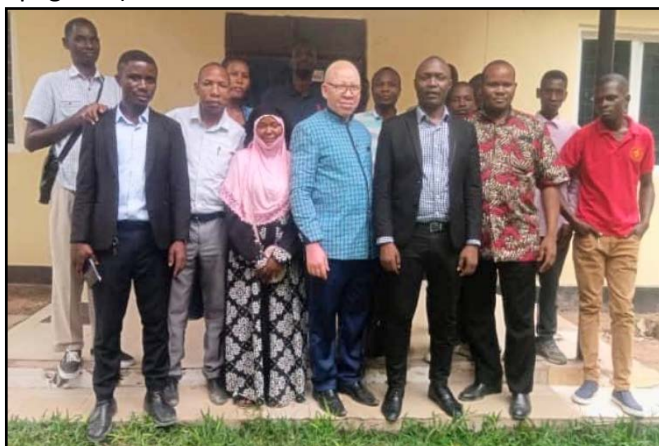
Nieuwe kerk in Shinyanga

haar solide trainingsprogramma voor studenten, evangelisten en leiders. (Zie artikel over training op pagina *)