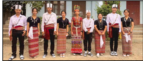
Gekleed in traditionele kleding voor de 'Dag van de Gehandicapten'

We zijn verheugd te kunnen melden dat de Muir School voor Doven in Kalay goed functioneert. In andere delen van Kalay is het een slagveld, maar onze school functioneert de laatste tijd onder 'normale' omstandigheden. Geen van beide partijen heeft in de buurt van de school gevochten en we zijn dankbaar voor de vrede die het personeel en de leerlingen genieten. Dit wil niet zeggen dat we niet door de oorlog worden