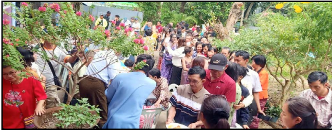
Yangon Kerk viert kerstmis

hartelijk wanneer we het evangelie delen, andere negeren ons. Hoe dan ook, we zijn dankbaar voor de kans om het evangelie met hen te delen."