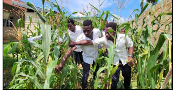
Majs, der vokser i skolens køkkenhave.