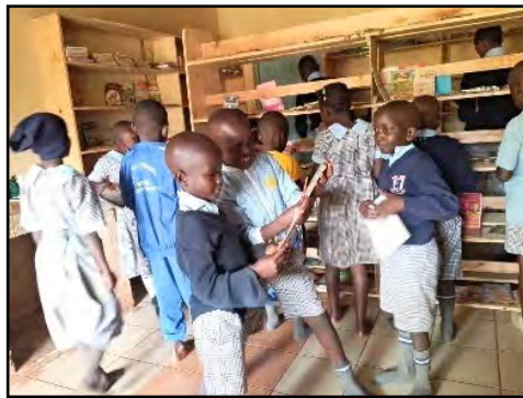
Studerende i biblioteket